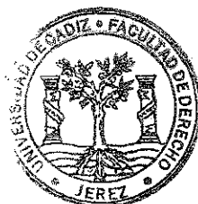
Secretaría de Departamentos